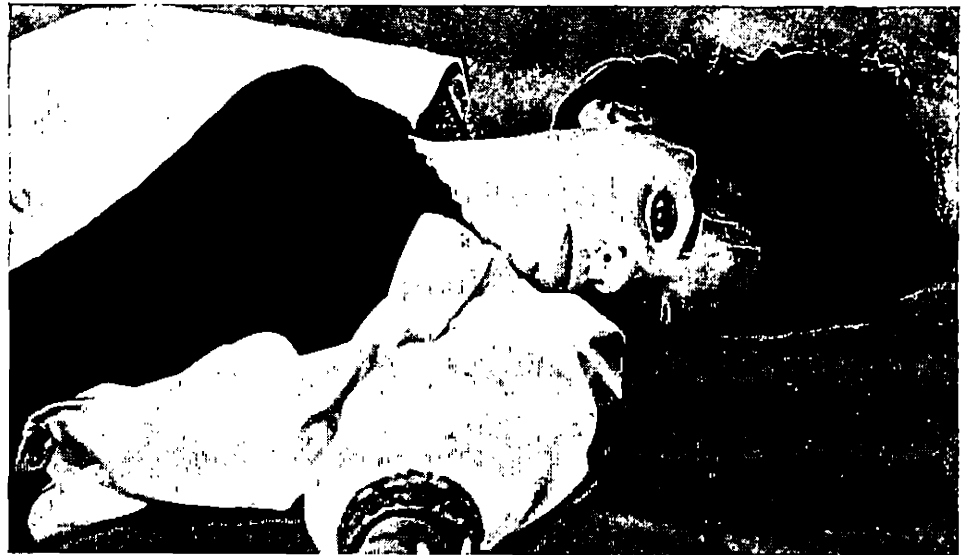
Julie Dassin dans « La Musica » de Marguerite Duras et Paul Seban.

Duras C'est ça, c'est très très juste. C'est-à-dire que cette longue durée... Terne. Banale. Grise et sale. Aurait été, évidemment, cassée. Ça, vous imaginez bien que j'ai dû lutter, pas mal, pour garder cette longueur. Beaucoup de gens m'ont dit : c'est impossible ;